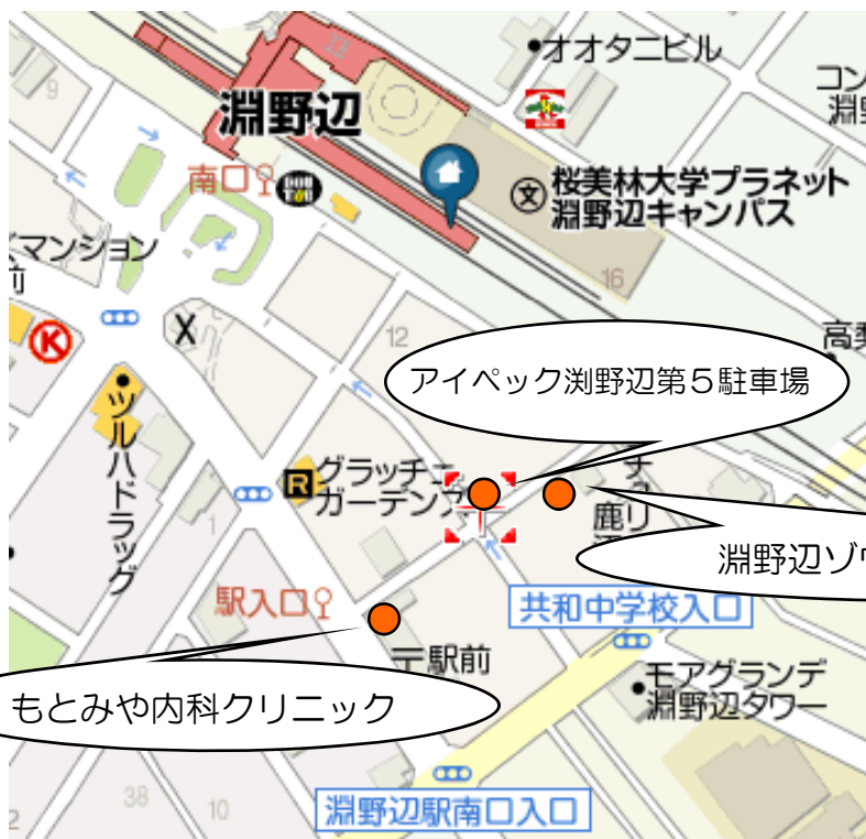
アイパック淵野辺第5駐車場

*こちらの駐車長は、一般の方も利用いたしますので、駐車できない場合もございます。ご了承ください。